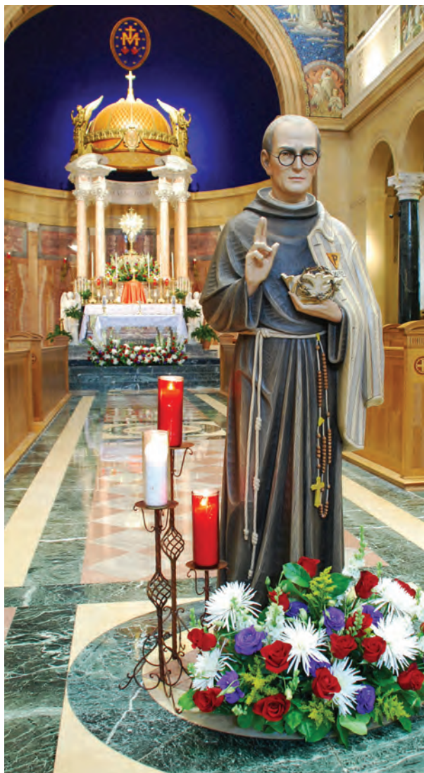
National Shrine of St. Maximilian Kolbe 1600 W. Park Avenue • Libertyville, IL 60048

V Polonijna Pielgrzymka do Narodowego Sanktuarium św. Maksymiliana Marii Kolbego w Marytown (Niepokalanów USA)